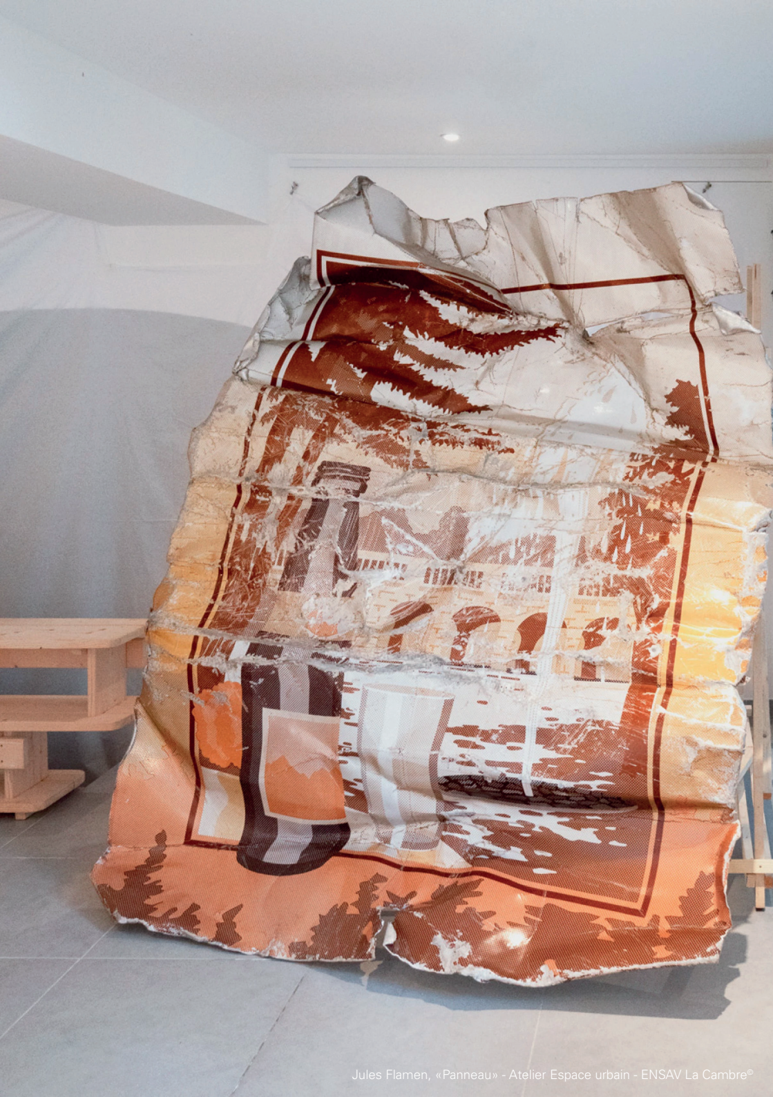
Jules Flamen, «Panneau» - Atelier Espace urbain - ENSAV La Cambre®