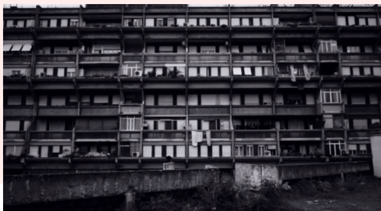
Morandi will tell you how storms are created and how things disappear completely, 2020