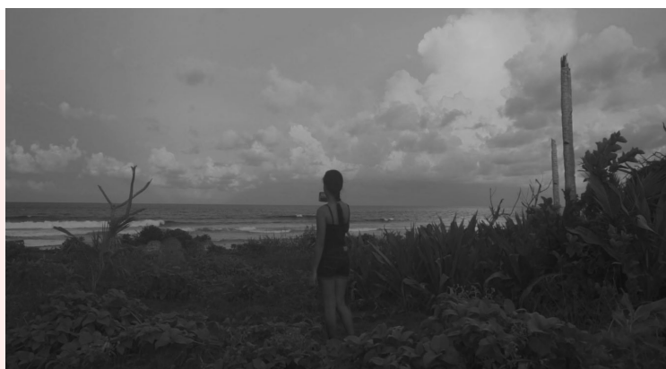
Memories of the waves, 2016