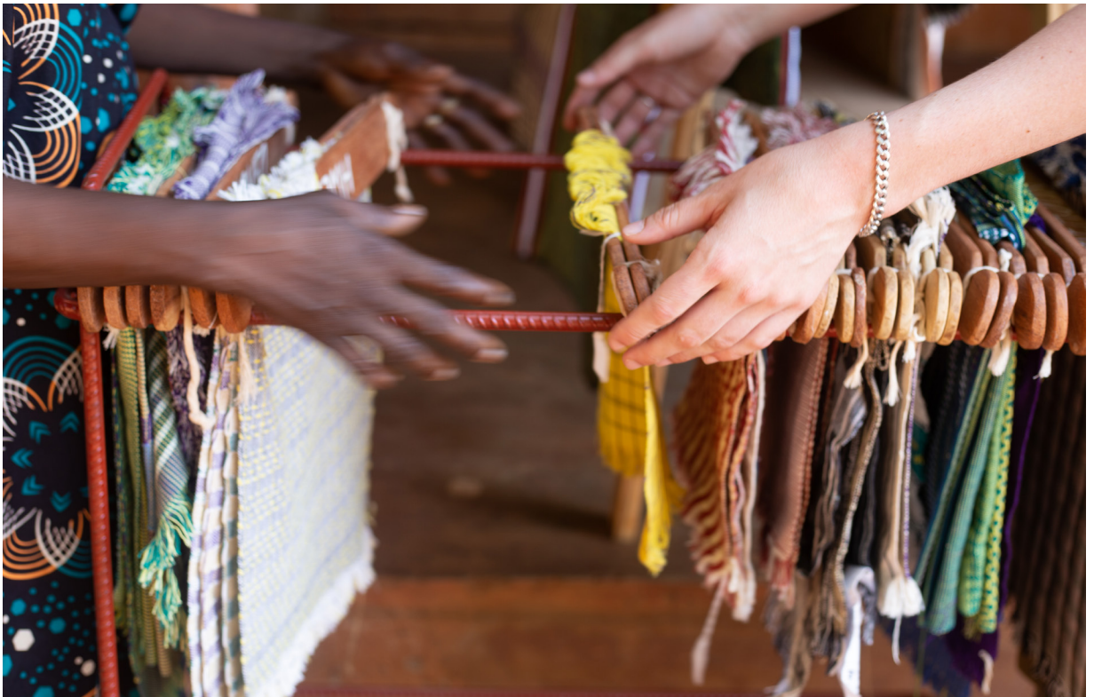
Archives des variations de tissus, 2023 © Victor Blanchevoye