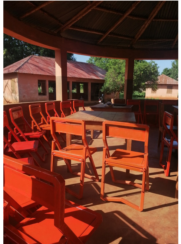
Prototype de fauteuil, 2022,