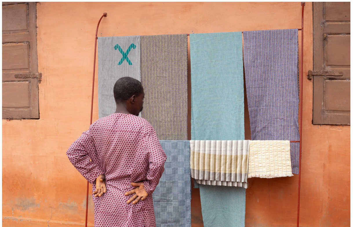
Variations tissées et prototype de structure de présentation, 2023 © Victor Blanchevoye