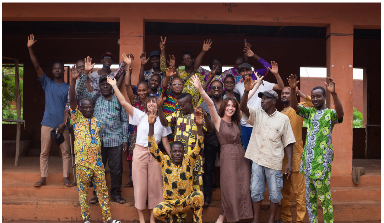
Stage d'été, 2023