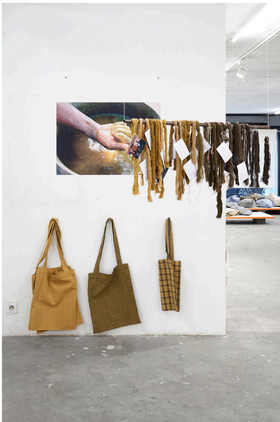
Exposition à La Cambre Bruxelles, 2022 © Sarah Duby