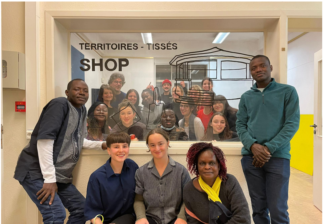
Exposition à La Cambre Bruxelles, 2021