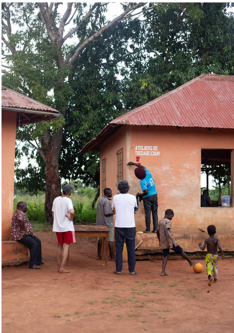
Peinture de la signalétique par Euzebe Adjamalè, 2023