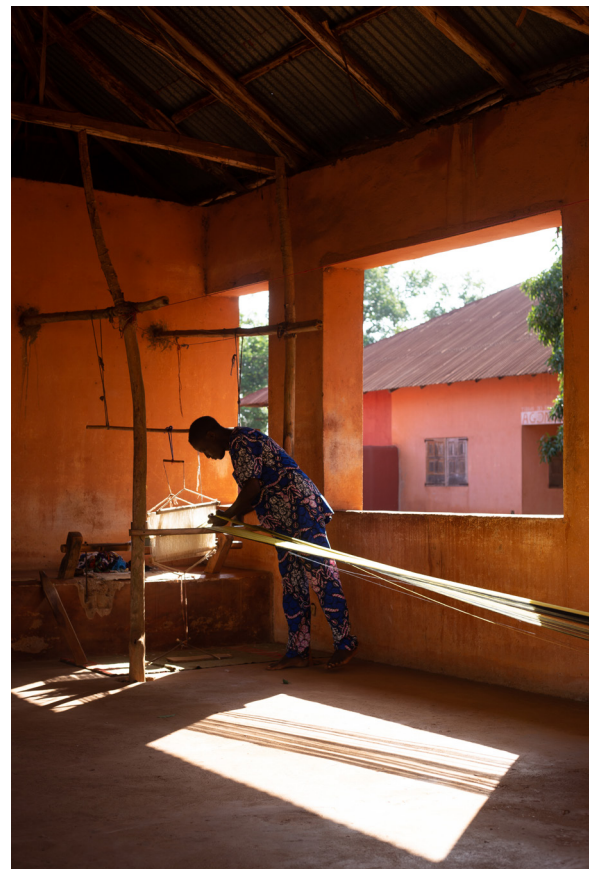
Atelier de tissage, Abomey 2023